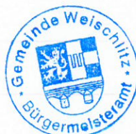
Steffen Raab Bürgermeister