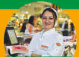
Ausbildung Metzgereifachverkäuferin (m/w/d) Vollzeit