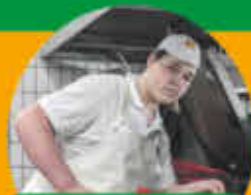
Ausbildung Fleischerin (m/w/d) Vollzeit