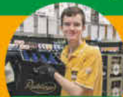
Ausbildung Einzelhandelskaufmann/-frau, Verkäuferin (m/w/d) Vollzeit